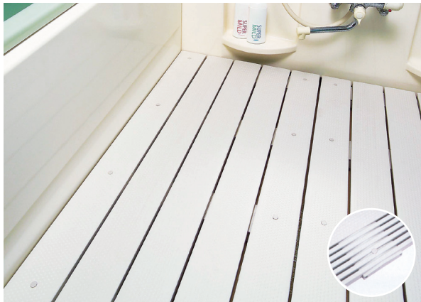
G (グレーチング) タイプ カラー：クリームグレー/アイボリー